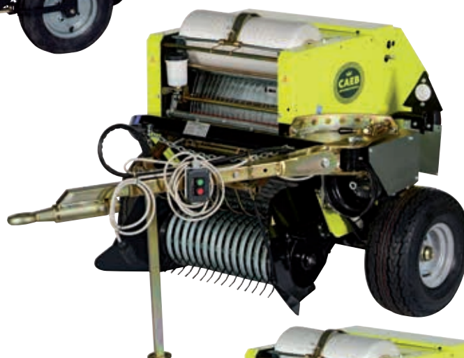
MOUNTAINPRESS 550 TPL