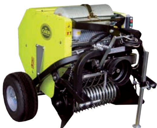
MOUNTAINPRESS 550 TPC