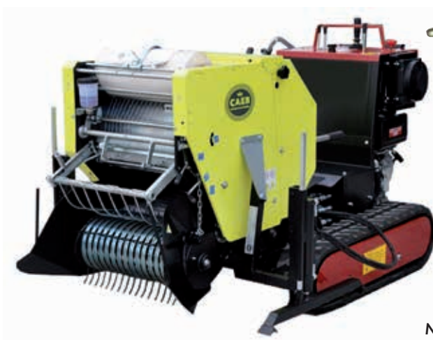
MOUNTAINPRESS 550 CNG

CAEB INTERNATIONAL srl via Botta Bassa, 22 - 24010 Petosino di Sorisole (BG) - Italy tel. +39 035 570451 - fax +39 035 4129105 - info@caebinternational.it - www.caebinternational.it